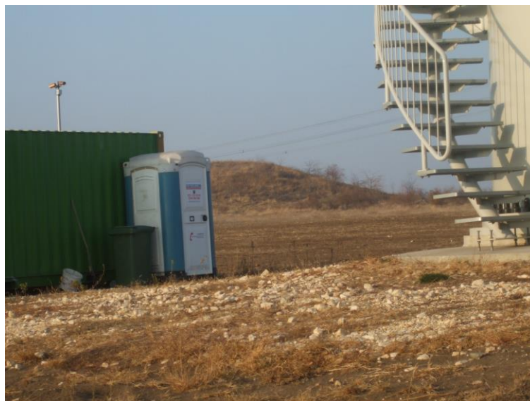
Foto 1. Container pentru paznici, grup sanitar ecologic și container pentru deseuri menajere

Datorită existenței serviciului de pază, în trei schimburi, rezultă ape fecaloide menajere, colectate în grupul sanitar ecologic (în baza contractului încheiat cu firma TOI - TOI) și deseuri menajere, care sunt colectate în containerul special, realizat din plastic; aceste deseuri sunt ridicate de Serviciul de salubritate din cadrul Primăriei Mihai Viteazu, în baza unui contract. Geștiunea deșeurilor este prezentată în anexa.