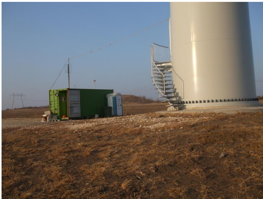
Foto 2. Container pentru paznici, pe care sunt montate două camere video, grup sanitar ecologic și container pentru deseuri menajere