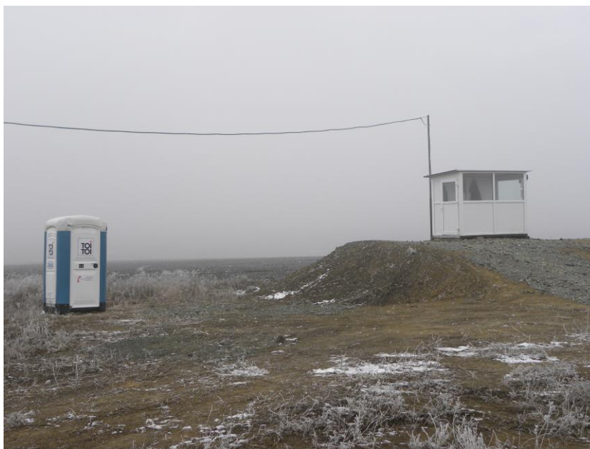
Foto 1. Cabina pentru paznici, grup sanitar ecologic si container pentru deseuri menajere (amplasat in interiorul cabinei)

Datorita existentei serviciului de paza, in trei schimburi, rezulta ape fecaloid menajere, colectate in grupul sanitar ecologic (in baza Contractului de locatiune nr. 5182/01.02.2011 incheiat cu SC TOI TOI & DIXI SRL – vidanjarea se face in fiecare saptamana) si deseuri menajere, care sunt colectate in containerul special, realizat din plastic; aceste deseuri sunt ridicate de Serviciul de salubritate din cadrul Primariei Pantelimon, in baza Contractului de colectare deseuri menajere nr. 1083/11.04.2011 incheiat cu Consiliul Local al Comunei Pantelimon. Gestiunea deseurilor este prezentata in anexa.