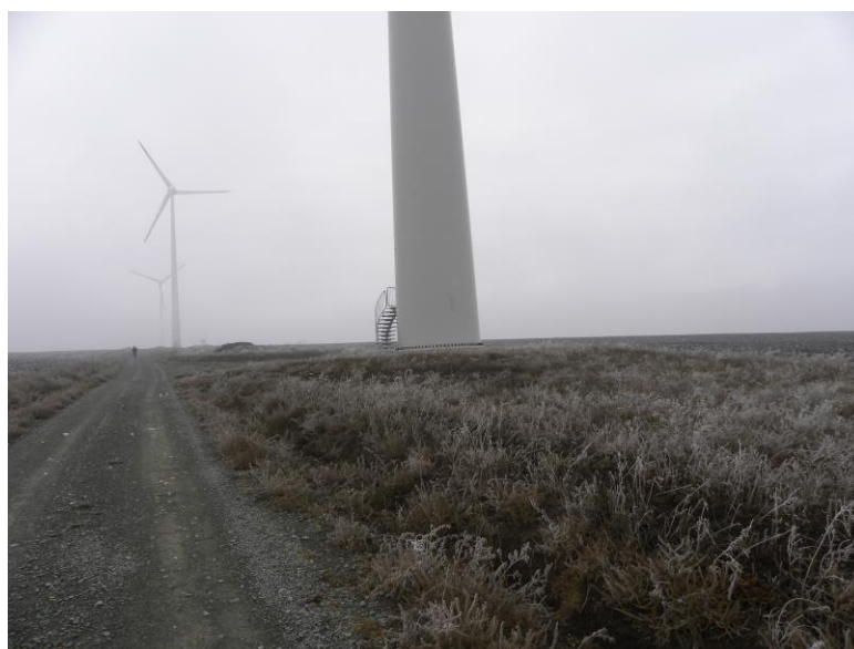
Foto 4. In zona fundatiilor, solul a fost inierbat