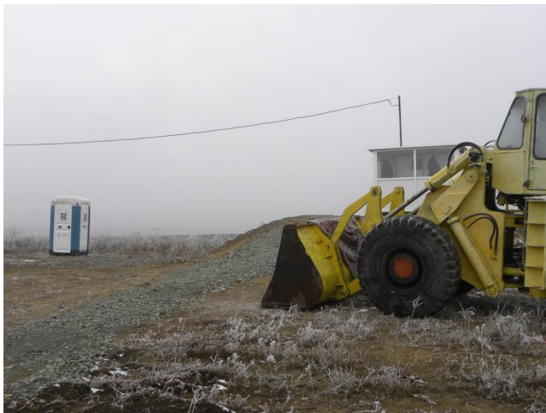
Foto 2. Cabina pentru paznici, grup sanitar ecologic si utilaj pentru curatirea zapezii