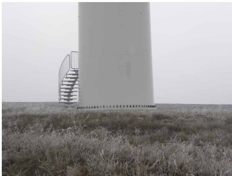
Foto 3. In zona fundatiilor, solul a fost inierbat

fost refacute prin acoperirea cu sol vegetal, a fost inierbat, astfel incat cantitatea de praf generat de vant a fost redus. In timpul functionarii unui parc eolian, acesta nu are impact asupra aerului.