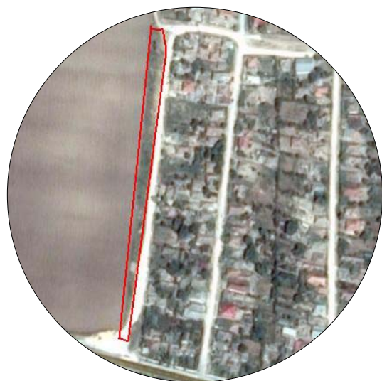
INCADRARE IN ZONA scara 1:50.000

OBIECTIV: "INTRODUCERE IN INTRAVILAN SI LOTIZARE TEREN PENTRU CONSTRUIRE DE LOCUINTE - Localitatea SATU NOU, Zona VESTICA" AMPLASAMENT: Strada VISINULUI FN, Loc. SATU NOU, MIRCEA VODA, jud. CONSTANTA