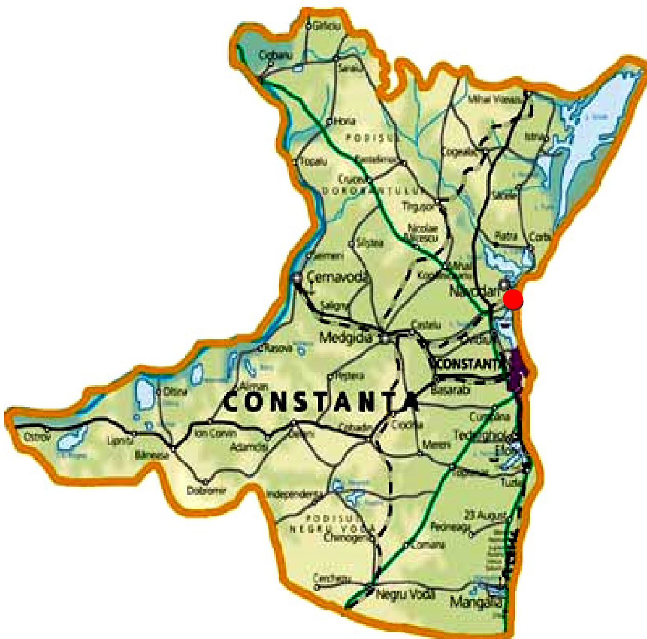
PLAN DE ÎNCADRARE ÎN JUDEȚ