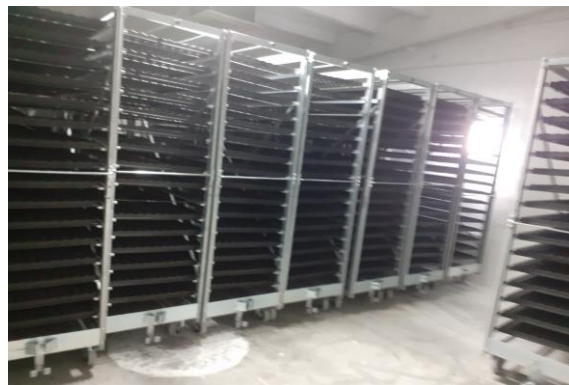
carucioare cu site de incubatie pentru oua