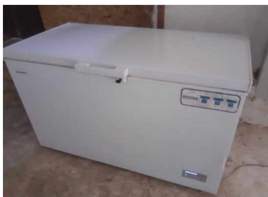
lada frigorifica pentru mortalitati