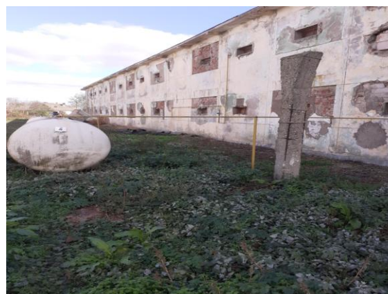
sistem alimentare GPL