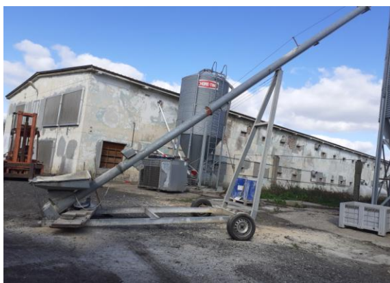
sistem alimentare cu furaje