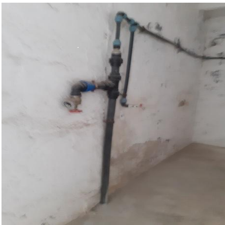
sistem hidranti interiori

Pe reseau de distributie a apei, pe peretii halelor, exista montati hidranti.