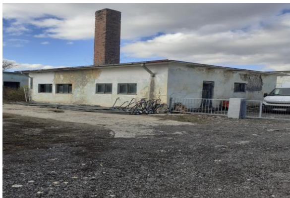
cladire fosta centrala termica