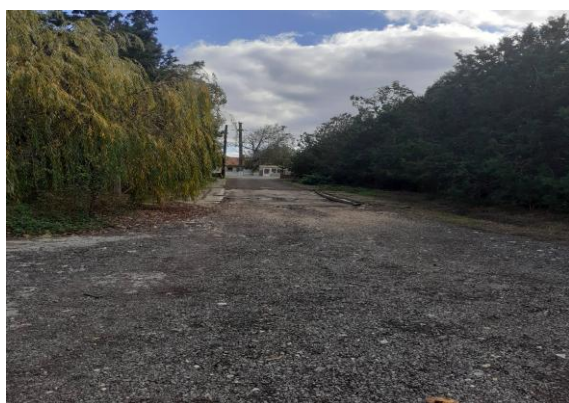
alee de acces in ferma