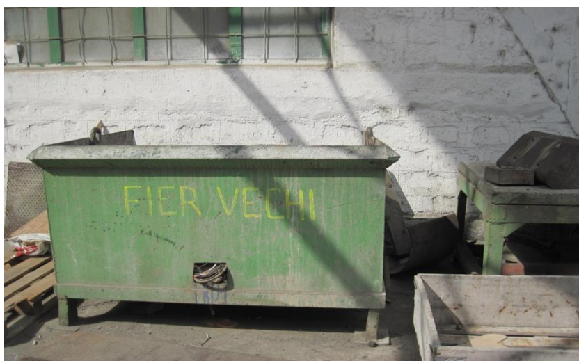
Foto: stocare temporara deseuri metalice din activitatea de mentenanta