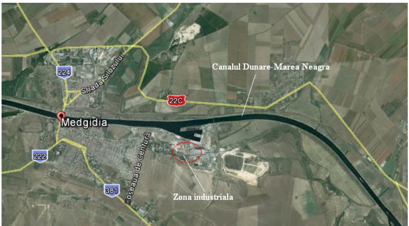
Figura: Apele de suprafata din zona amplasamentului

Apa de suprafata din zona amplasamentului instalatiei este reprezentata in principal de Canalul Dunare-Marea Neagra.