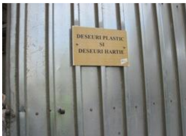
Foto: stocare temporara deseuri de hartie/carton si plastic