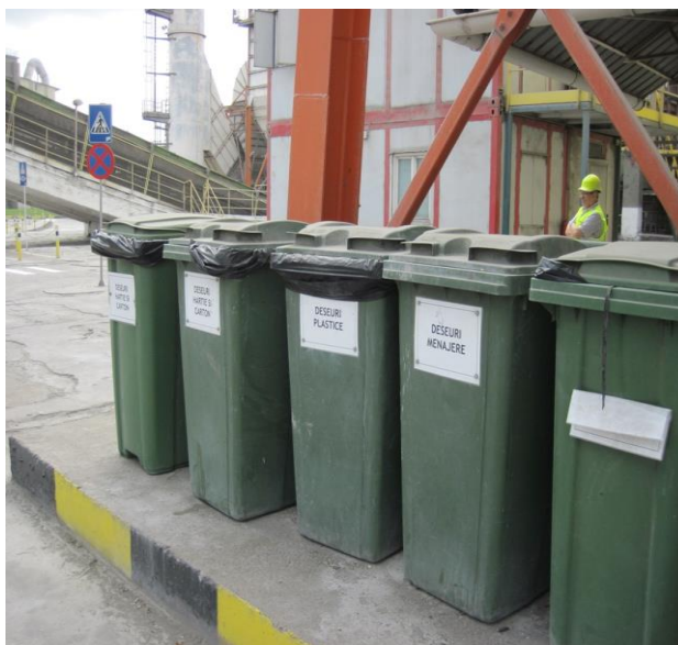
Foto: colectare selectiva deseuri

Transportul deșeurilor, dacă este cazul, se face cu respectarea legislației în vigoare în domeniu (H.G. nr.1061/ 2008 privind transportul deșeurilor periculoase și nepericuloase pe teritoriul României).