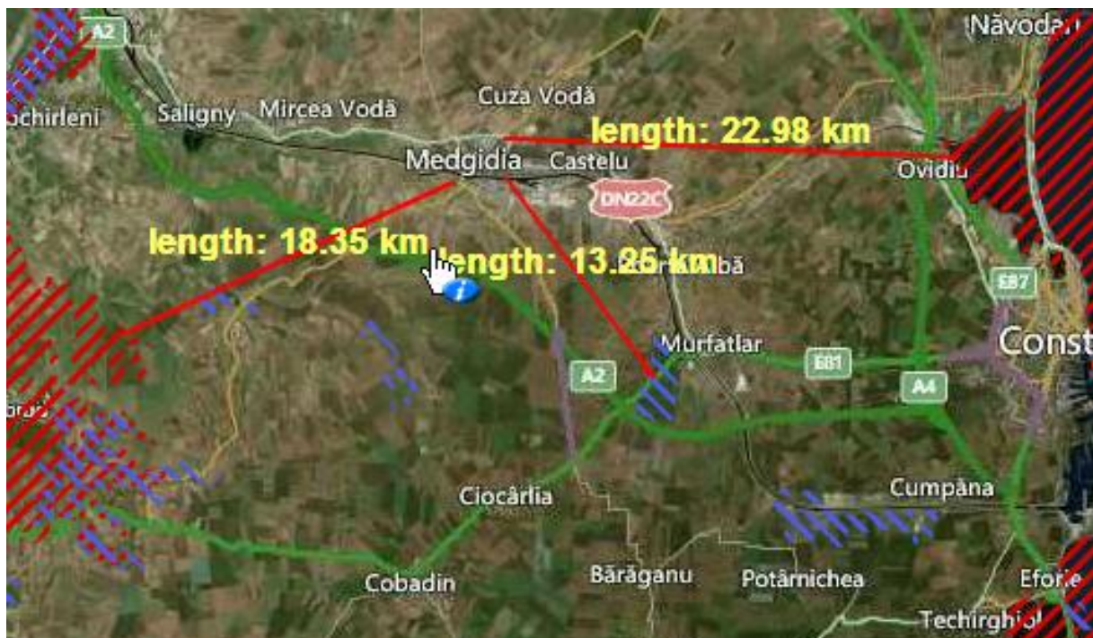
Figura: Distanțele pana la ariile protejate din cadrul rețelei Natura 2000

In conditiile actuale de stepa, fauna caracteristica este dominata de rozatoare (popandaul, soarecele de camp, dihorul de stepa, nevastuica) si pasari (graurul, cotofana, potarnichea, ciocarlia,etc.).