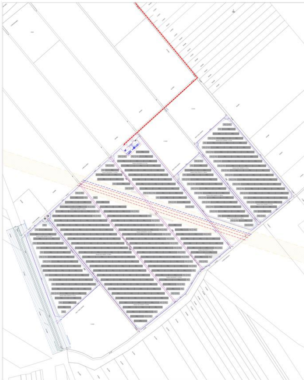
Fig. 3.1. Plan de situatie parc fotovoltaic