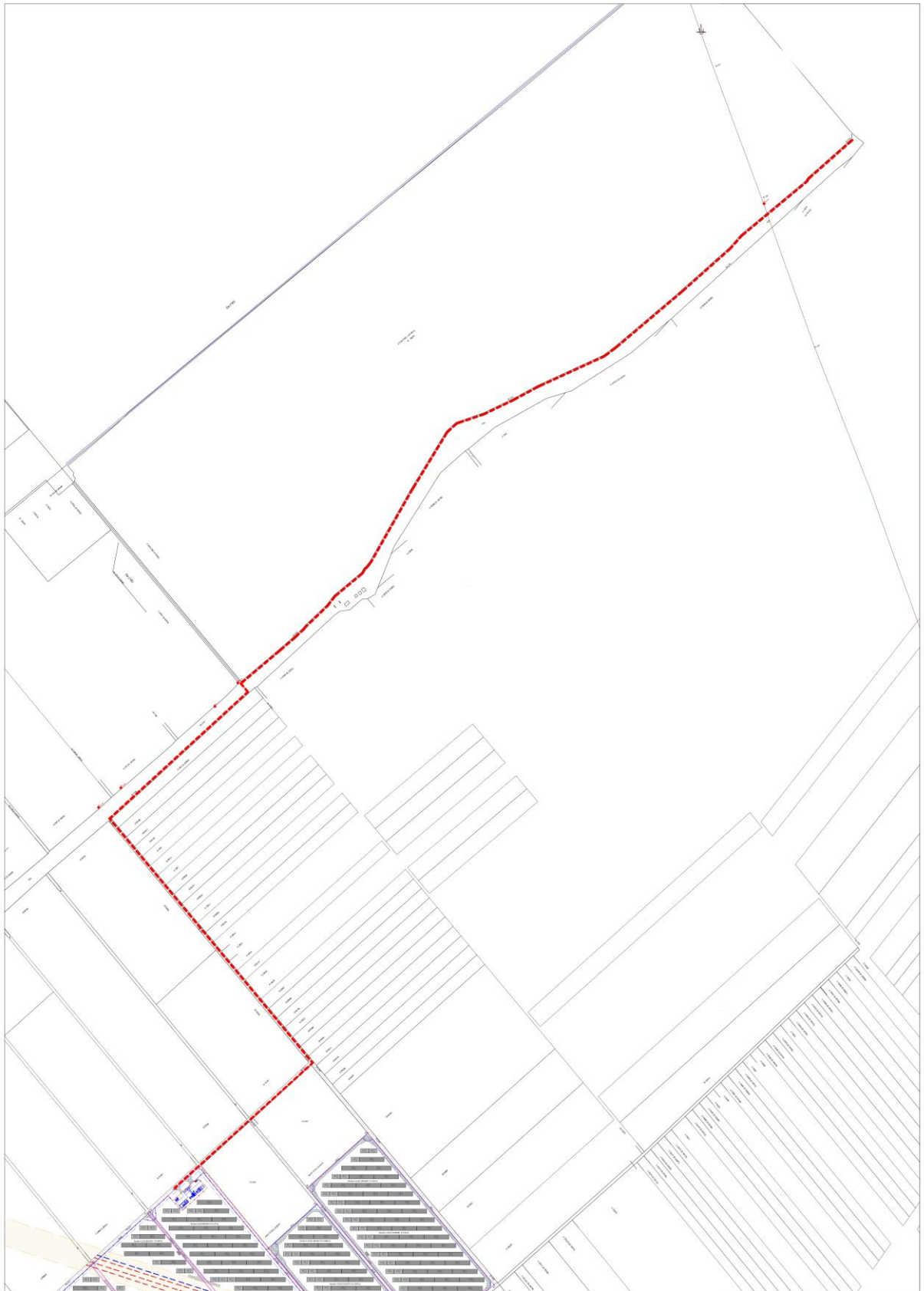
Fig. 3.2. Plan de situatie amplasare LES