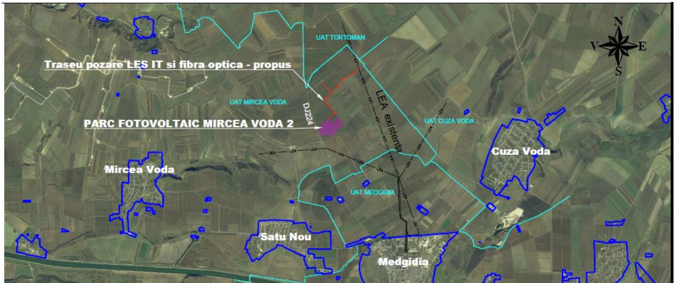
Fig. 1. Zona studiata

- Nord-Vest - DE 2211 și Parcelele V2216/2 și V2212/2