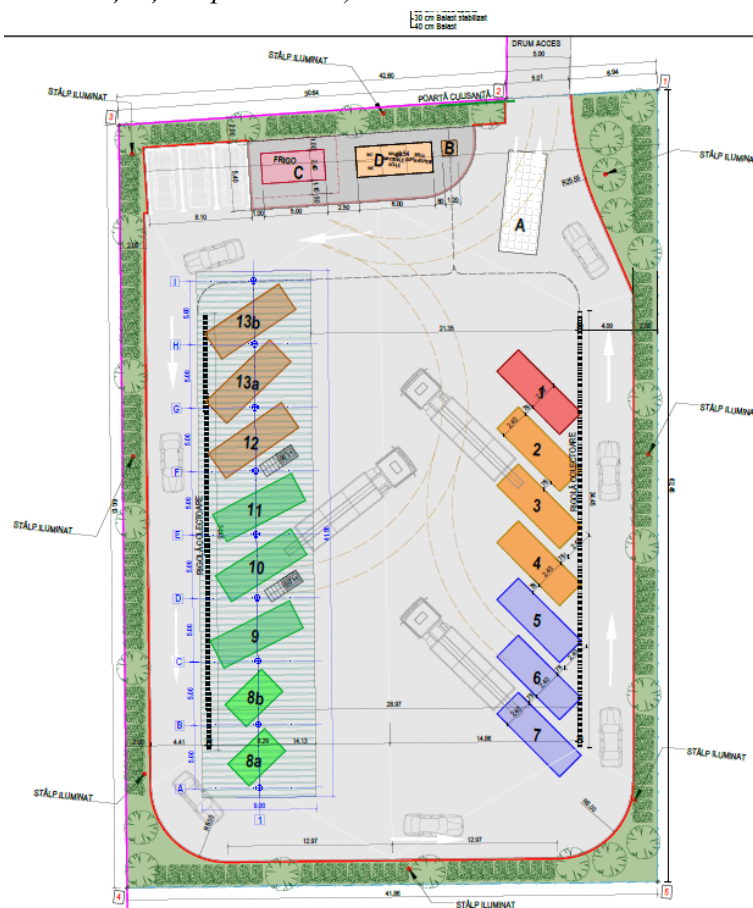
Plan de situație al amplasamentului